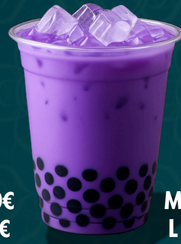
TARO LATTÉ TAPIOCA