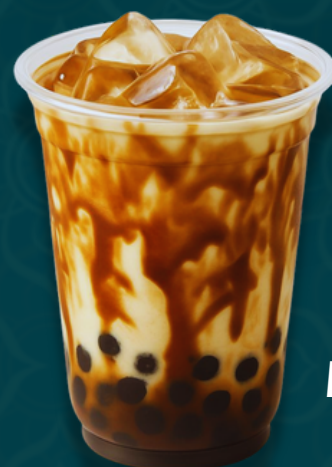
BROWN SUGAR TAPIOCA