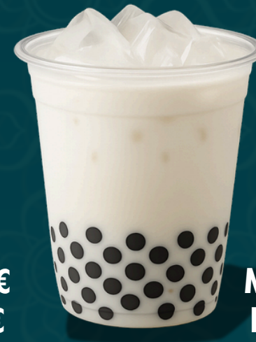
ÇOCO LATTÉ TAPIOCA