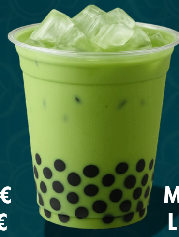
MATCHA LATTÉ TAPIOCA