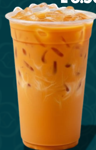
FRAISE MOJITO M 5.50€ L 6.50€