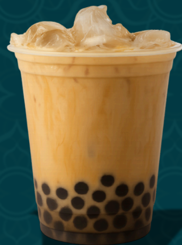
MOJITO CLASSIQUE M 5.50€ L 6.50€