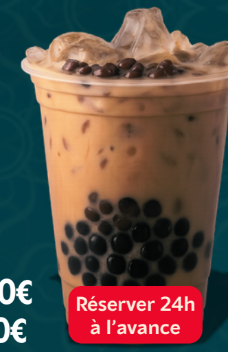
HARICOT ROUGE LATTÉ TAPIOCA