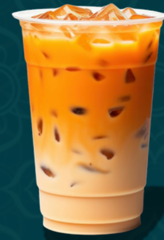
FLORAL M 5.50€ L 6.50€