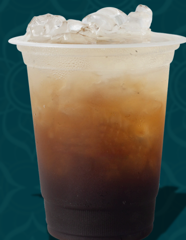
TROPICAL M 5.00€ L 6.00€