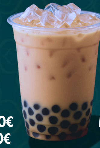
THÉ NOIR AU LAIT TAPIOCA