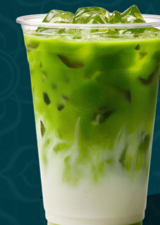
GREEN MILK TEA M 5.50€ L 6.50€